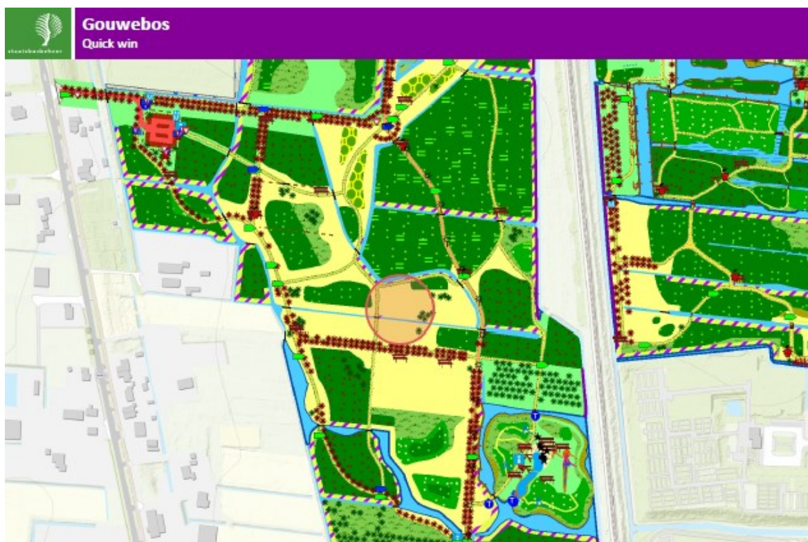
Figuur 2.3 Locatie (cirkel) uit te voeren quick win Gouwe Bos