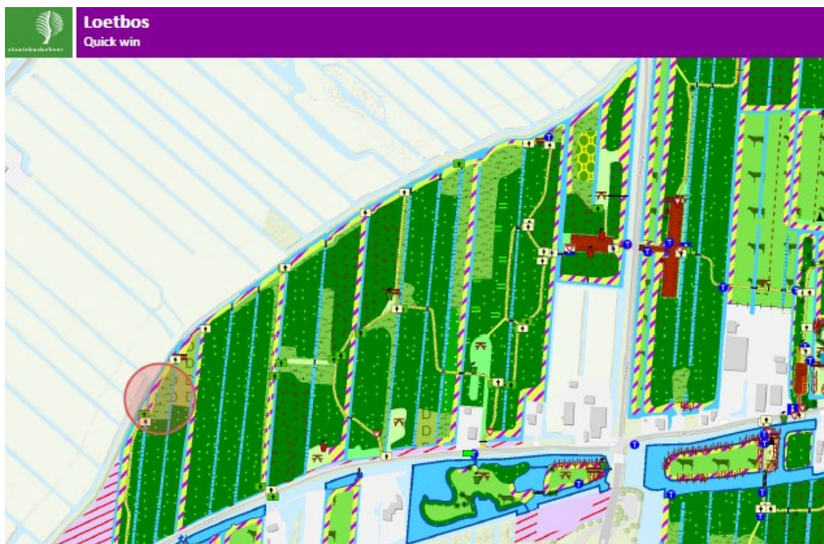
Figuur 2.5 Locatie (cirkel) uit te voeren quick win Loetbos