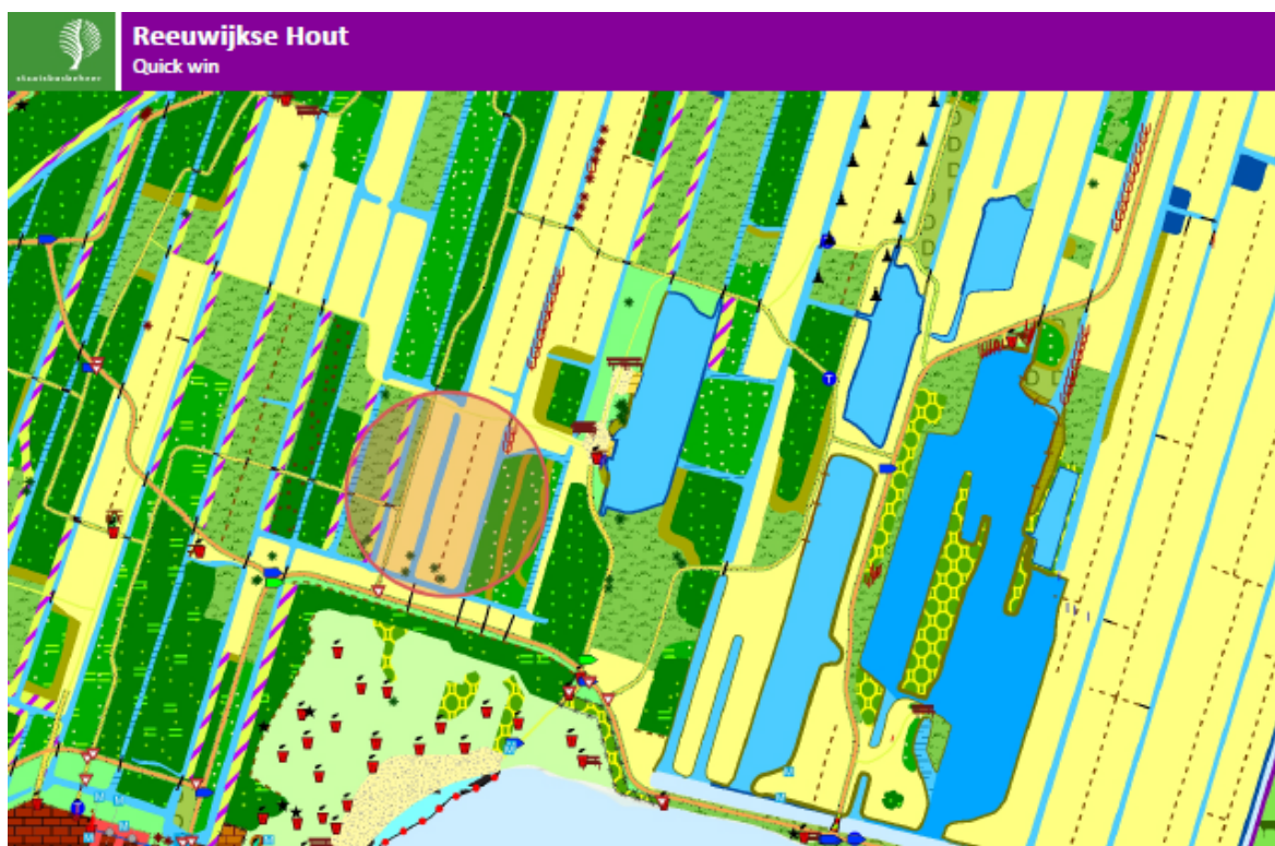
Figuur 2.1 Locatie (cirkel) uit te voeren quick win Reeuwijkse Hout