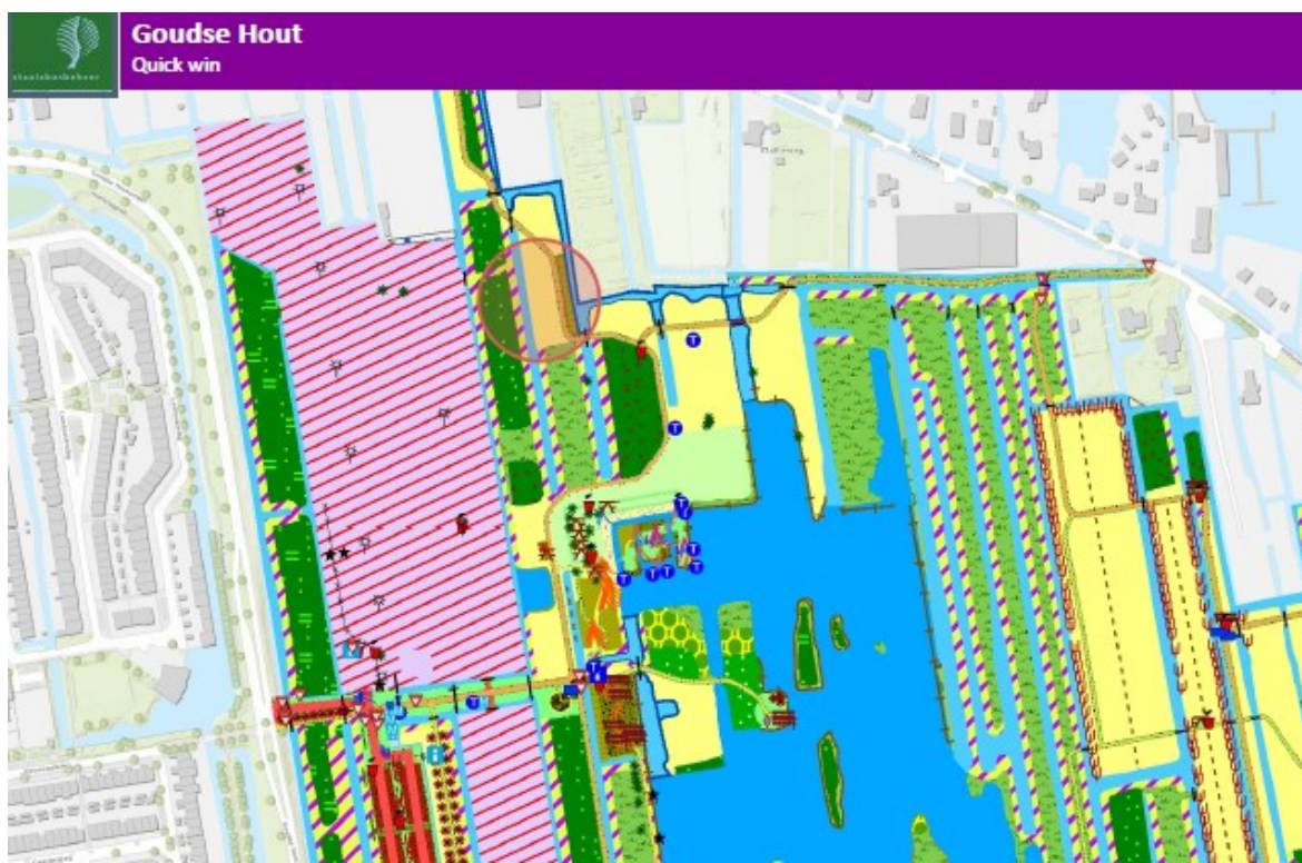
Figuur 2.2 Locatie (cirkel) uit te voeren quick win Goudse Hout