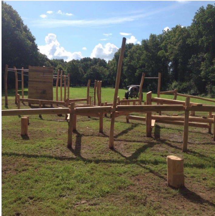
Referentiebeeld houten Freerunpark