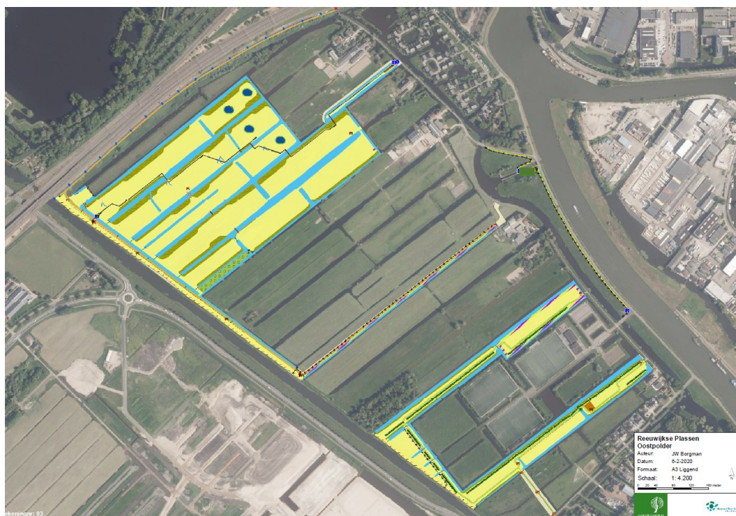
Figuur 1: eigendom Groenalliantie (geel gearceerd)

De Oostpolder is een niet verveend gebied liggend tussen de Gouwe en de provinciale weg N207 (zie figuur 1) Het noordelijk deel en de randbeplanting rondom het sportcomplex 'De Donk' zijn in eigendom van het natuur en recreatieschap Groenalliantie Midden Holland e.o. (Groenalliantie) en worden in opdracht van Groenalliantie beheerd door Staatsbosbeheer.